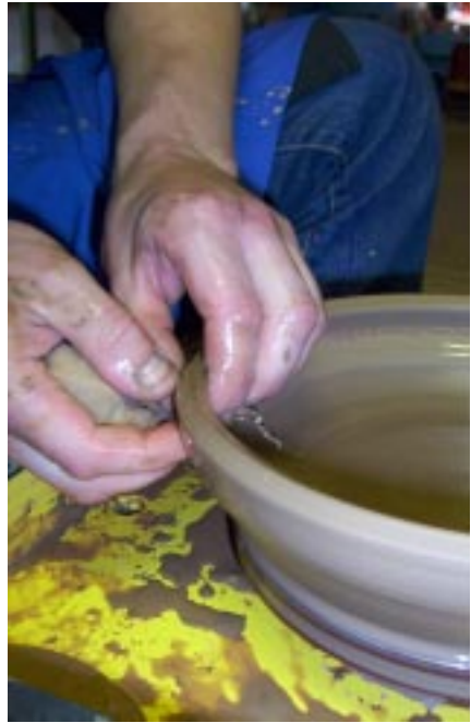
Создание открытой формы

По мере работы, внутри сосуда накапливается глиняная жижка. Если ее периодически не удалять, то она под действием центробежной силы размоет нижнюю часть сосуда. Для удаления жижки используйте «колобок». Набранную «колобком» жижку отжимайте в тазик с водой.