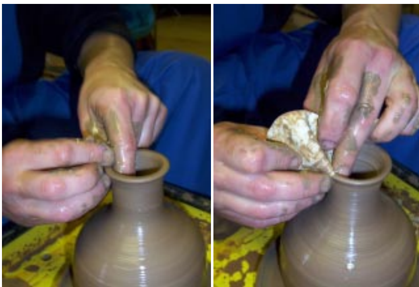
Формовка верхнего края сосуда