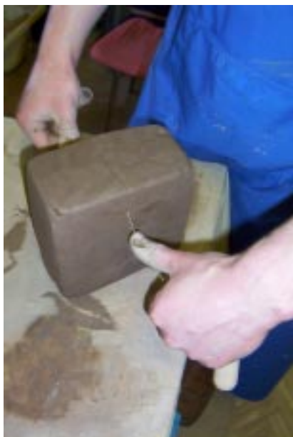
Вертикальный разрез бруса