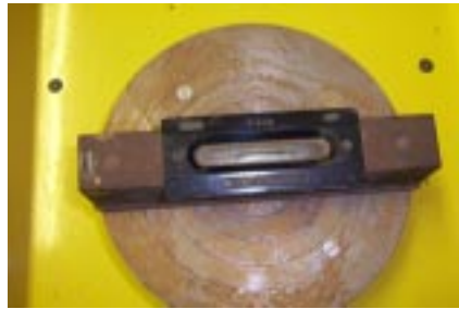
Установка и выверка гончарного круга по уровню

Налейте в тазик (чуть больше половины) воды комнатной температуры и поставьте его в корыто, за планшайбой. Пустой тазик поставьте в пространство под гончарным кругом и опустите в него кончик резинового шланга (второй кончик этого шланга должен быть одет на патрубок корыта).