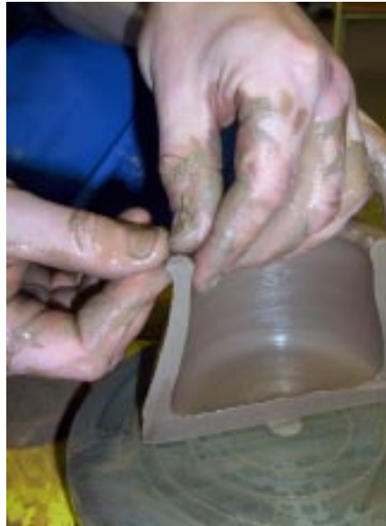
Формовка верхнего края