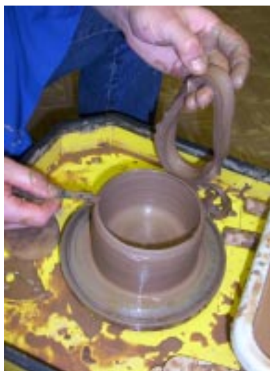
Снятие дефектного фрагмента