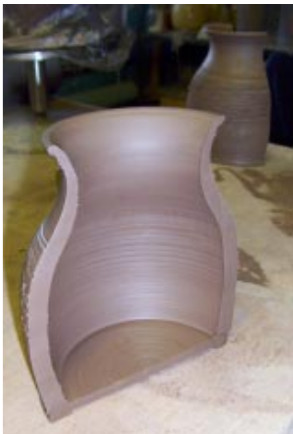
Сечение готового изделия