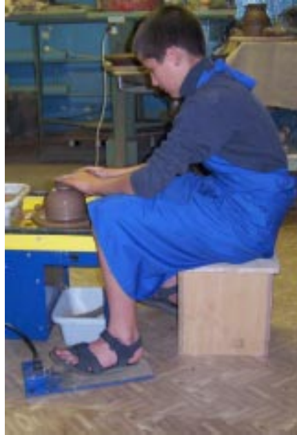
Посадка за гончарным кругом

Для комфортной и продолжительной работы за гончарным кругом необходимо обеспечить анатомически правильное положение вашего тела. Главное условие – угол между голенью и бедром должен быть несколько больше 90 градусов (в этом положении ноги практически не затекают). Уровень бедер должен быть несколько выше уровня планшайбы (при работе правая рука опирается на бедро и прижимается к правому боку). Высота посадки достаточно просто регулируется подкладыванием под тумбу кусочков толстой фанеры. Для обеспечения длительной работы за кругом требуется мягкая подушка на крышке тумбы (стульчика). Можно просто надеть специальный чехол с поролоновой подушкой.