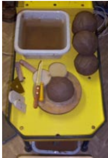
Рабочее место гончара

Налейте в тазик (чуть больше половины) воды комнатной температуры и поставьте его в корыто, за планшайбой. Пустой тазик поставьте в пространство под гончарным кругом и опустите в него кончик резинового шланга (второй кончик этого шланга должен быть одет на патрубок корыта).