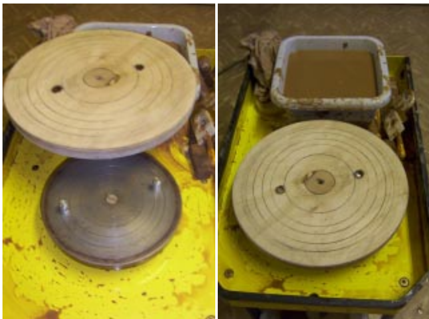
Одевание сменного кружка на планшайбу