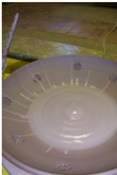
Растекание ангоба (большие обороты планшайбы)