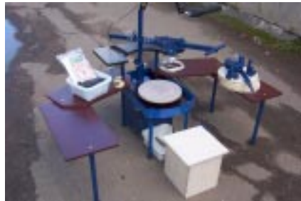
На фото модель PROFI-MAX.

Слева: в комплектации «MINI»; справа: в комплектации «VIP»