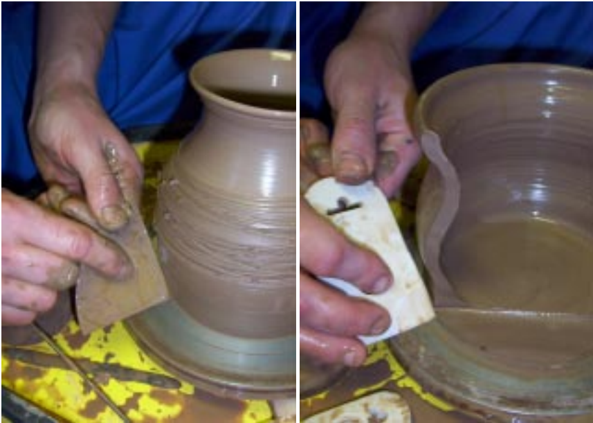
Проточка низа сосуда с помощью шаблона

Во время формовки изделия было необходимо сохранять достаточную толщину нижней части изделия – ведь на нее давила масса всего изделия! При уменьшении ее толщины изделие бы просто «свалилось». Проточку проводите шаблоном, понемного подводя от к краю изделия и углубляясь. Старайтесь получить профиль, представленный на фото.