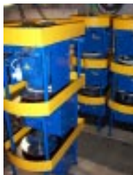
Гончарный круг PROFI-MAX (комплектация MINI).

Производим сувенирную и эксклюзивную керамику.