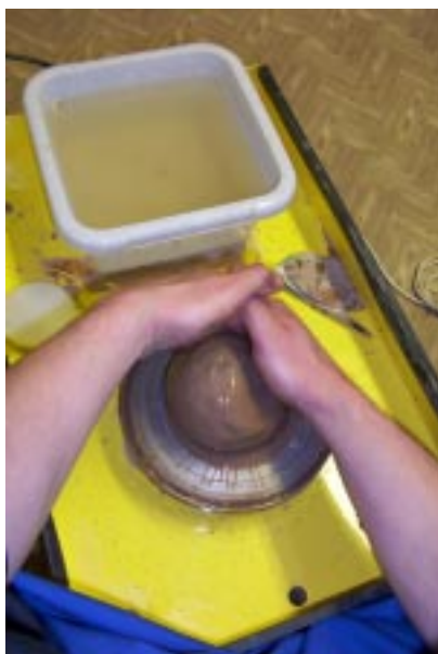
...и снова центровка!