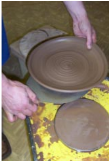
Снятие готовой тарелки с помощью лопатки-шпателя