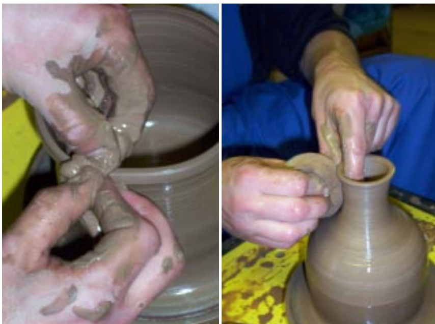
Формовка верхнего края сосуда