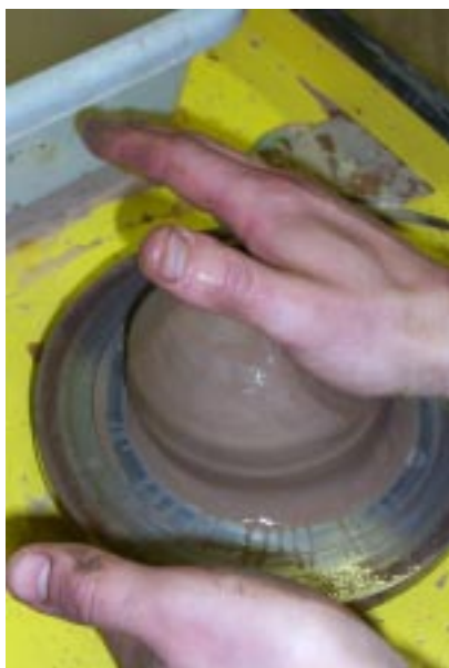
Боковой удар ладонью справа – для децентровки