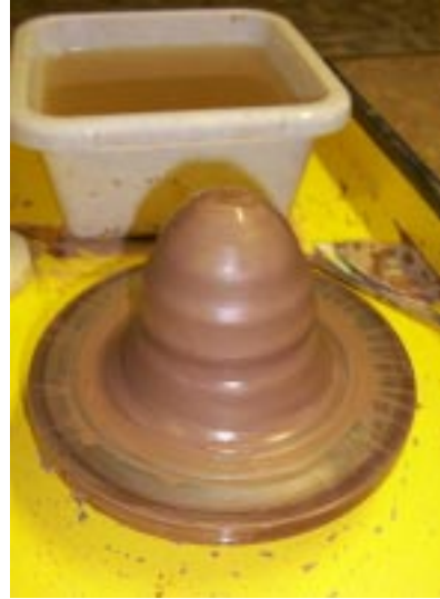
Отцентрированный ком глины

успешной центровки, легким боковым ударом по изделию нарушайте его центровку, и снова центруйте. Повторяйте эту процедуру до автоматического закрепления навыков.