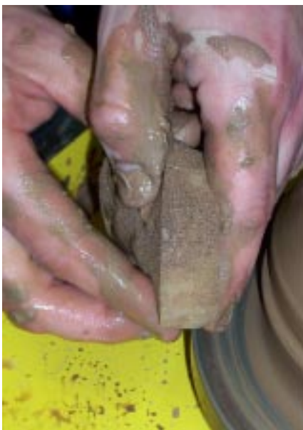
Использование губки при вытягивании