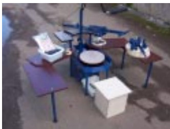
Гончарный круг PROFI-MAX (VIP-комплектация).