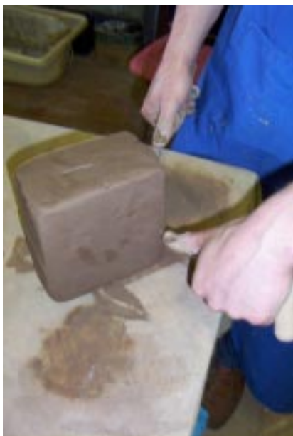
Горизонтальный разрез бруса