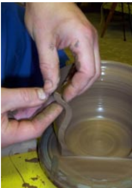
Отбортовка верхнего края