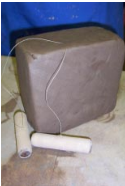
Брус глины и струна с ручками