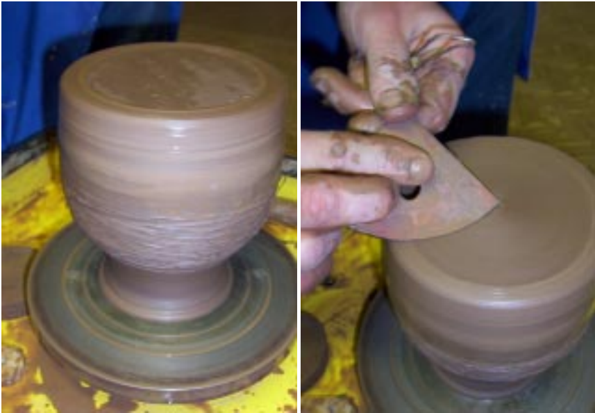
Закрепление изделия на планшайбе и начало проточки стеком

При сушке готовых изделий не форсируйте этот процесс!! – сушите 6-10 дней при температуре 18-20 градусов в помещении без сквозняков – иначе неизбежны внутренние напряжения в глине, и как следствие – разрыв при обжиге!