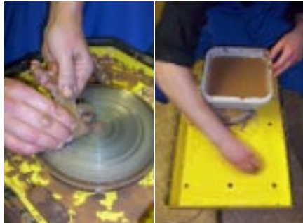
Уборка рабочего места

После завершения работы на гончарном круге, необходимо его полностью очистить от следов глины. Для мойки круга используйте поролоновые губки (стараясь как можно чаще промывать их в воде – меньше будете царапать декоративное покрытие...). Завершив мойку, протрите ветошью все поверхности насухо. При появлении налета ржавчины на поверхности планшайбы, достаточно на полных оборотах поднести к ней кусочек сухой древесины. Не используйте наждачную бумагу!!