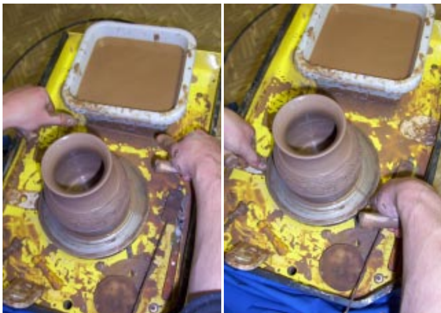
Срезание изделия с планшайбы