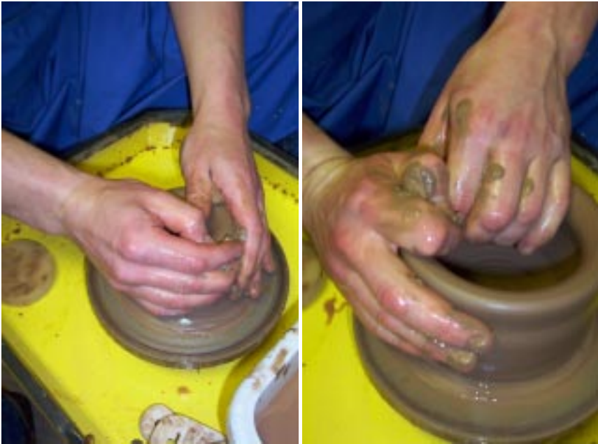
Начало формовки заготовки