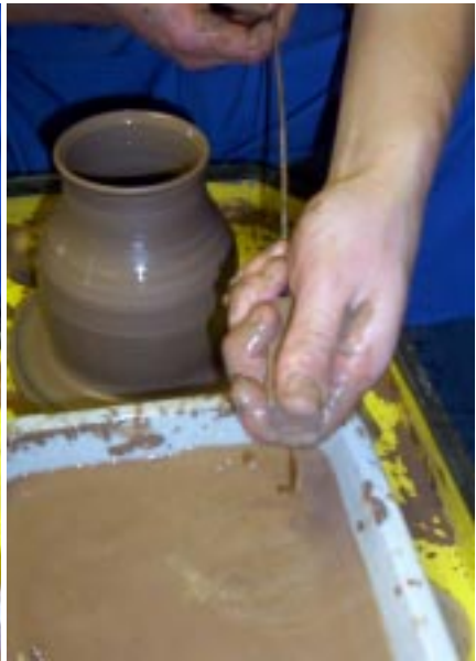
Удаление глиняной жижки «колобком»