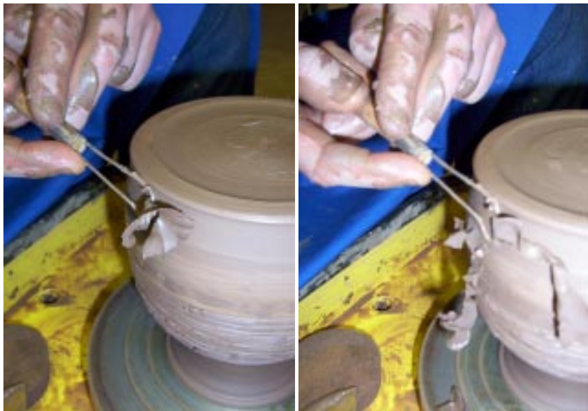
Обтачивание боковой поверхности