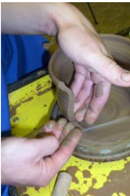
Правильное положение рук при вытягивании стенки изделия