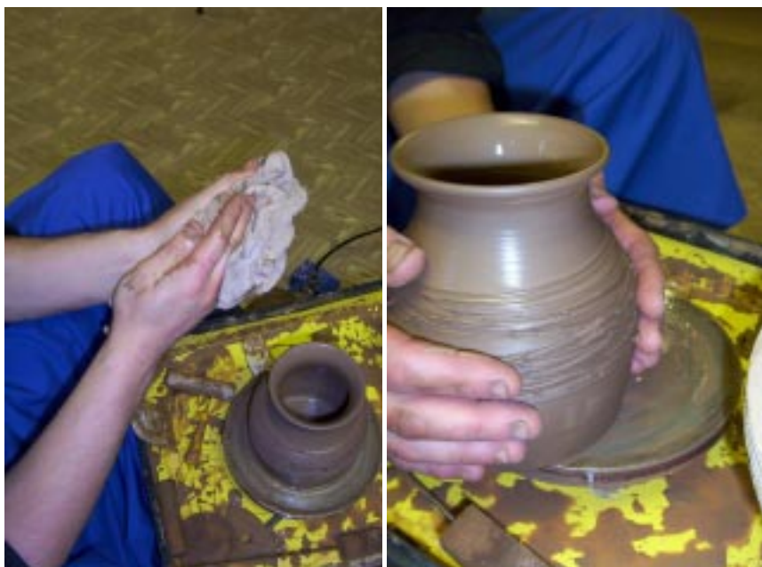
Снятие изделия с планшайбы