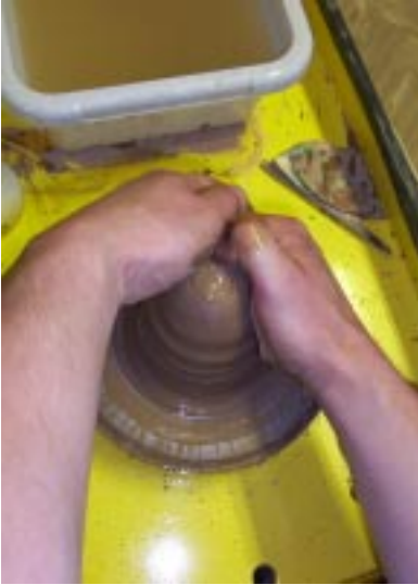
Усилие рук направлено к центру и к себе