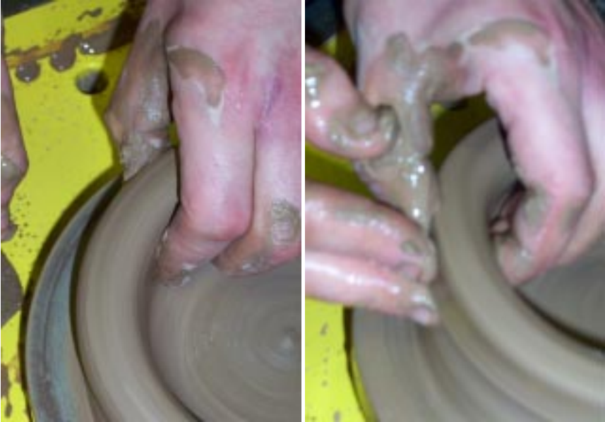
Захватив валик глины, тихонько тяните его вверх

С открытой формой работать очень сложно – необходимо постоянно ловить обороты планшайбы! Стоит сильнее нажать