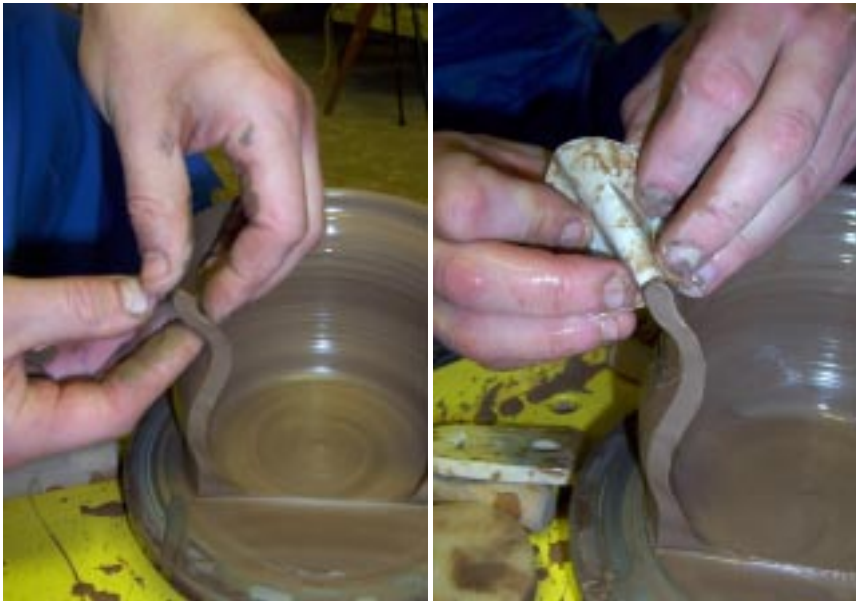
Формовка верхнего края сосуда

УПРАЖНЕНИЕ. Пробуйте переходить от закрытой формы к открытой, и наоборот. Для усложнения работайте с закрытыми глазами.