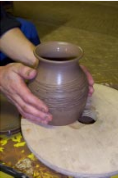
Снятое с планшайбы изделие

Слегка покачивая, снимите изделие с планшайбы и поставьте на фанерку для подсушивания.