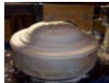
Шаблон + гипсовая форма..