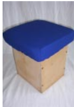
Мягкая подушка для ящика-тумбы