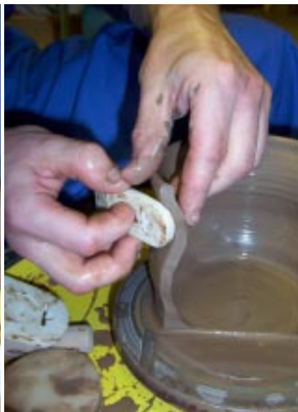
Положение рук и резинового стека при сужении сосуда