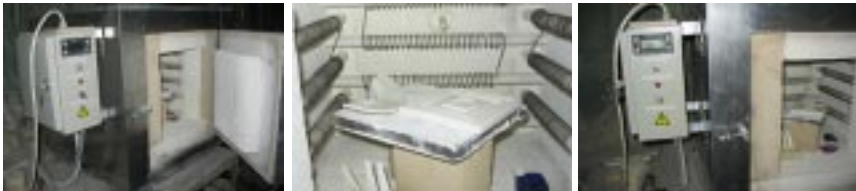
На фото изображена печь для обжига керамики. Фирма «ХОРСС», г. Москва

Электрическая мощность составляет 5 кВт. Ток: 23 А.