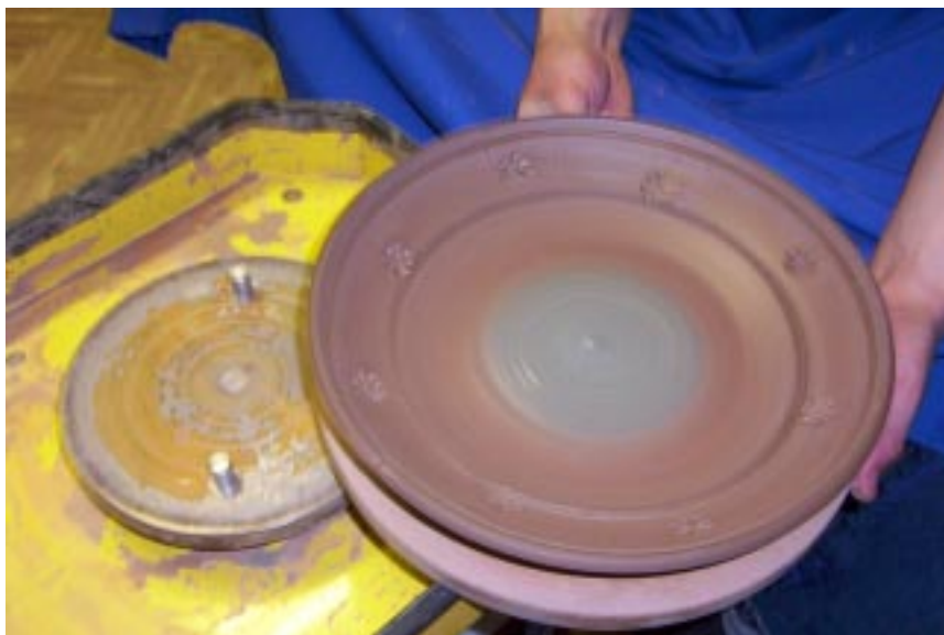
Снятие фанерного кружка с изделием с планшайбы