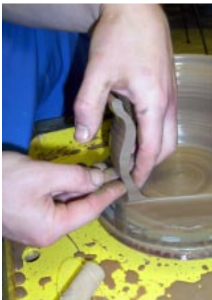
Оформление нижней части